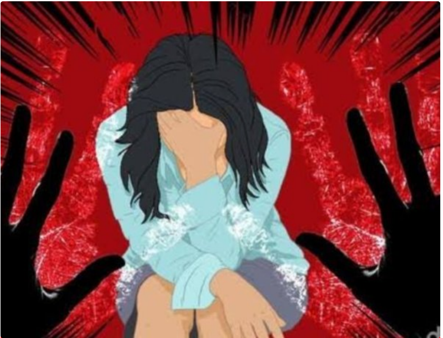
Gambar animasi pencabulan anak bawah umur

BANYUWANGI - Tindak pencabulan dan Persetubuhan terhadap anak dibawah