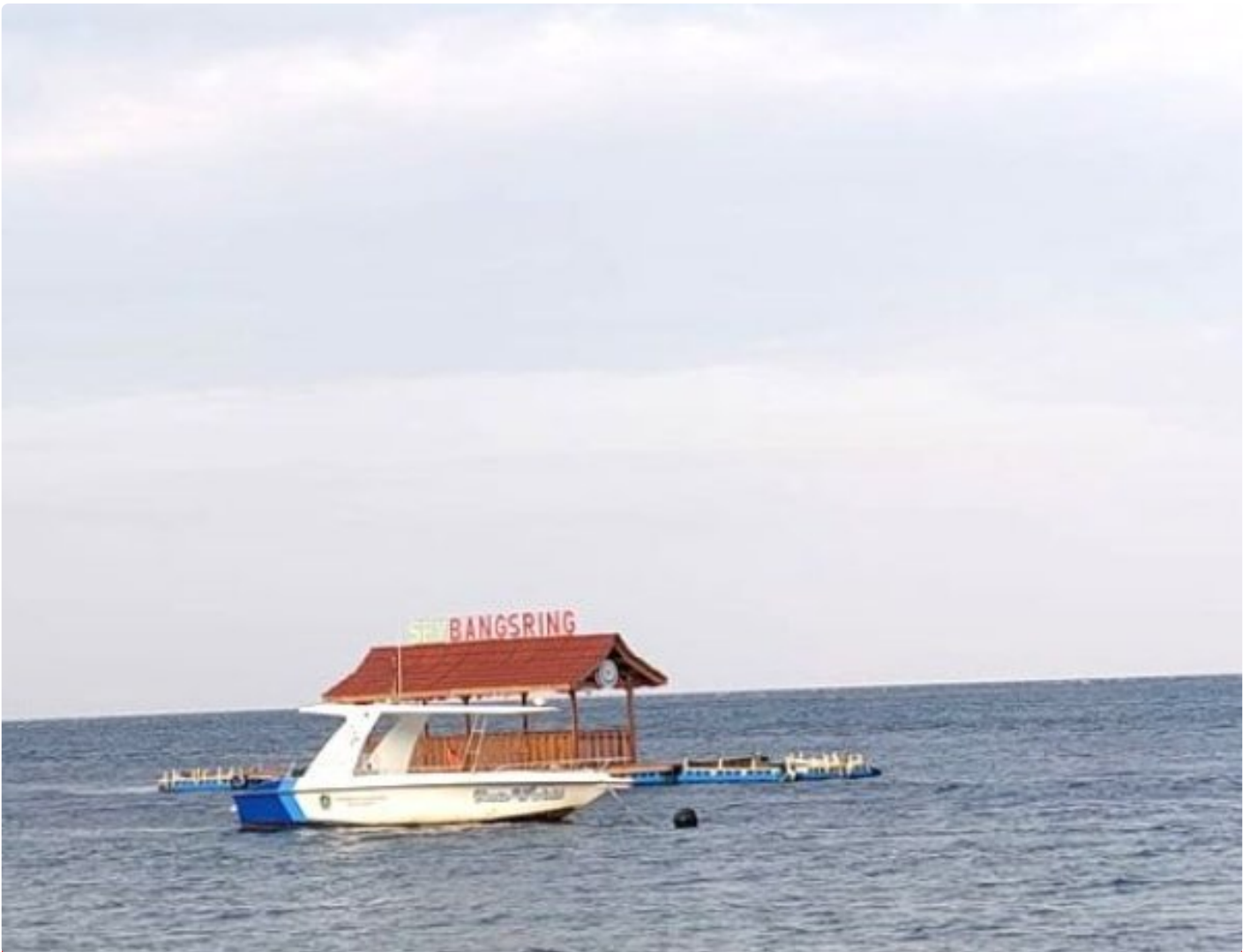
Wisata bahari rumah apung bangsring di perairan selat Bali

BANYUWANGI - Kabupaten Banyuwangi, Jawa Timur, selalu menjadi magnet